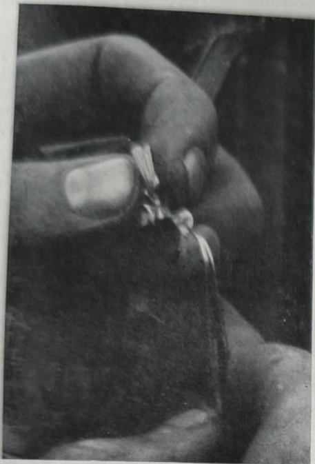
Abb. 2. Befruchtung der freigelegten Blüte durch Aufsetzen des Schiffchens.

Das Ausreifen des Pollens in den einzelnen Blüten sowie der Verlauf des Blühens geht bei heißer, trockener Witterung bedeutend schneller vor sich als bei kühler und feuchter, worauf Rücksicht zu nehmen ist.