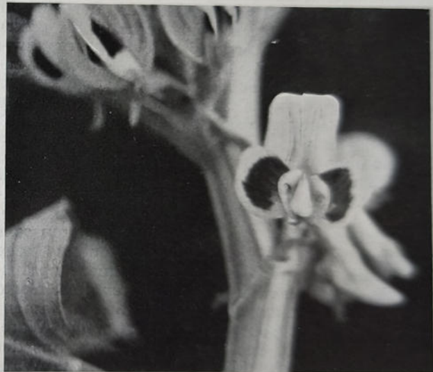
Abb. 3. Fertig befruchtete Blüte.

Der Vorteil dieser Arbeitsweise besteht darin, daß Narbe und Fruchtknoten durch das aufgesetzte Schiffchen geschützt sind und die Sicherheit der Bestäubung erhöht wird. Bei genaue-