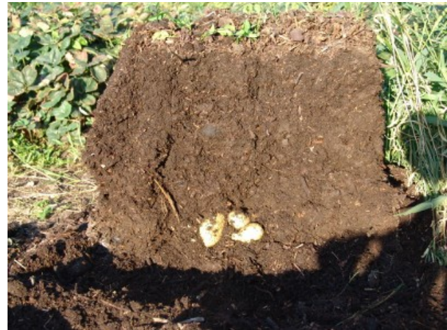
Querschnitt – ganz unten, sonst keine Knollen

Was die Bilanz aber ganz ins Minus treibt ist der Aufwand für das Befüllen und der Bedarf an passendem Material. Am Material scheitert es bei mir nicht, nur das Nachfüllen nervt. Also wenn ich ganz viel Lust habe, dann unternehme ich im nächsten Frühjahr, die Betonung liegt auf „Früh“ noch einen letzten Versuch. Im Vergleich dazu ist die Methode „Rasenkartoffel“ mit viel weniger Aufwand über die Wachstumsperiode verbunden.